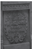
Gedenksteine zum Genozid an den Armeniern (1915) an der Außenwand der armenischen Kirche in Aleppo (2011). Heute zerstört.

Aktuellste Fotos via Smartphone liefern heute Verwandte und Freunde aus den Heimatländern der Geflüchteten. Sie sind mindestens so zuverlässig wie die Meldungen der Berichtersteller der westlichen Agenturen, die schon lange nicht mehr vor Ort arbeiten können. Mehrmals im Jahr bereist der Referent derzeit Israel, Palästina und Jordanien und lässt sich erklären, wie es gerade um die Christen im Nahen Osten bestellt ist.