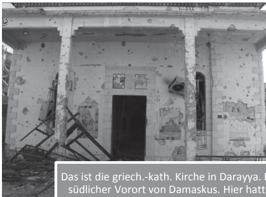
Das ist die griech.-kath. Kirche in Darayya. Ein südlicher Vorort von Damaskus. Hier hatte Paulus seine Offenbarung.

Zu den im Irak und Syrien niedergelassenen verfolgten Christen zählen bereits die Armenier, die 1915 dem Genozid in ihrer Heimat entronnen sind. Sie hatten bis vor fünfzehn Jahren eine stattliche, meist begüterte und einflussreiche Größe dargestellt. 1948/49 und 1967 folgten christliche Flüchtlinge aus dem Staat Israel, die in von der UN unterhaltenen Flüchtlingslagern wohnen. Nach dem Sturz Saddam Husseins im Jahr 2003 flohen viele Christen aus dem Irak nach Nordsyrien, um dort eine sichere Heimat zu finden. Seit 2011 migrieren alle, Armenier, christliche Iraker und Palästinenser, in fernere Anrainerstaaten.