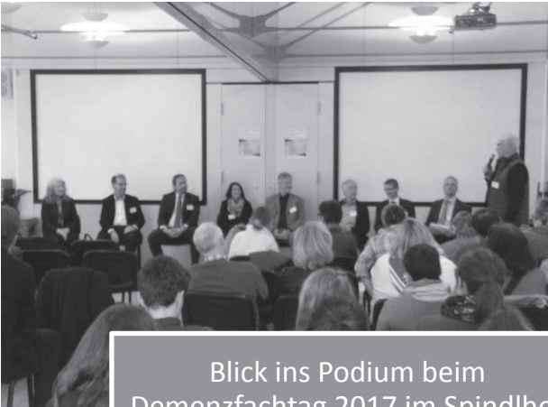
Blick ins Podium beim Demenzfachtag 2017 im Spindlhof