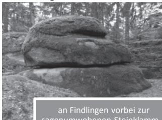
an Findlingen vorbei zur sagenumwobenen Steinklamm...

Am Beginn steht eine Führung der Pfarrkirche Ramspau, die im neoklassizistischen Stil erbaut wurde. Über schattige Wald- und Feldwege mit Sicht zum Münchshofener Berg geht es zu den bemoosten Findlingen der sagenumwobenen Steinklamm. Nach dem Weißen Kreuz führt unser Weg steil hinab zum Regen. Auf dem romantischen Uferweg erreichen